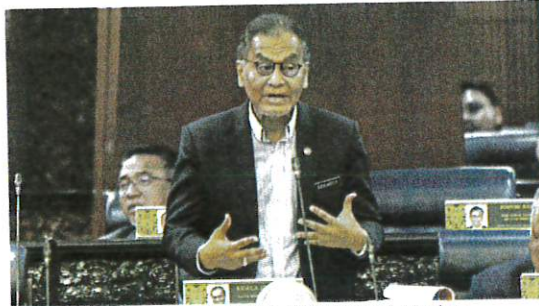
Dr Dzulkefly pada sesi jawab di Sidang Dewan Rakyat, semalam.