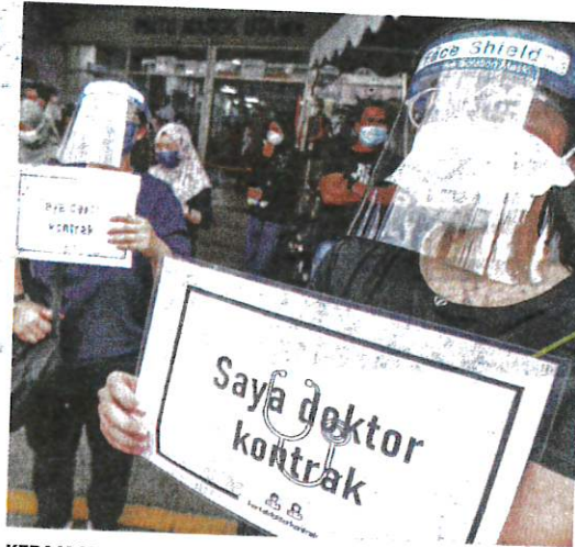
KERAJAAN melaksana pelbagai insentif bagi memastikan pegawai perubatan kekal bersama sektor awam. - GAMBAR HIASAN

Selain itu, menyentuh ganjaran dan imbuhan, beliau