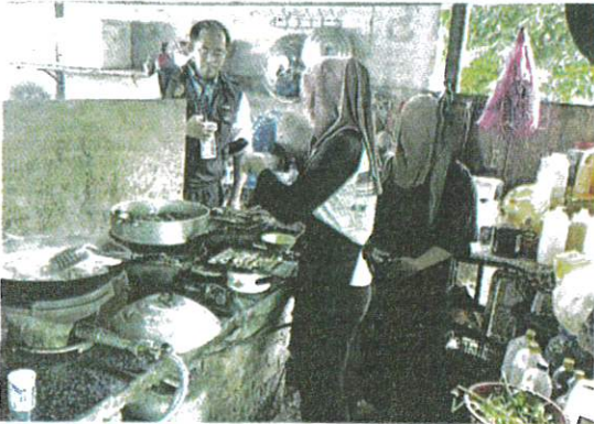
KEADAAN dapur sebuah premis di Pasir Puteh yang didapati kotor hingga dikhuatiri boleh mengundang pencemaran makanan.

AKHBAR : KOSMO MUKA SURAT : 16 RUANGAN : NEGARA