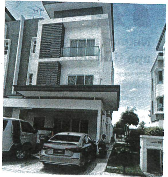
PUSAT yang menawarkan khidmat penjagaan dan rawatan ibu bersalin secara haram didakwa beroperasi sejak beberapa bulan lalu.

Tambah Norfiza, ini merupakan kesalahan serius kerana melibatkan bayi dan ibu yang melahirkan anak dan seterusnya, boleh mendatangkan risiko sekiranya berlaku kecuai.