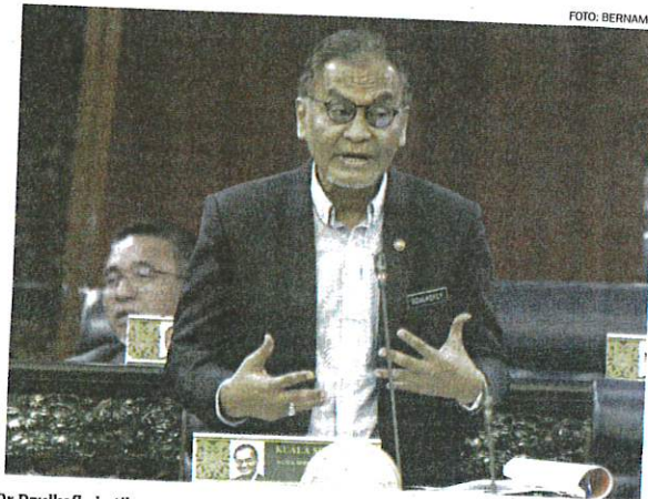
Dr Dzulkefly ketika sesi Waktu Pertanyaan-Pertanyaan Menteri ketika Persidangan Dewan Rakyat pada Rabu.

Dr Dzulkefly berkata, kerajaan melaksanakan pelbagai inisiatif untuk memastikan pegawai perubatan