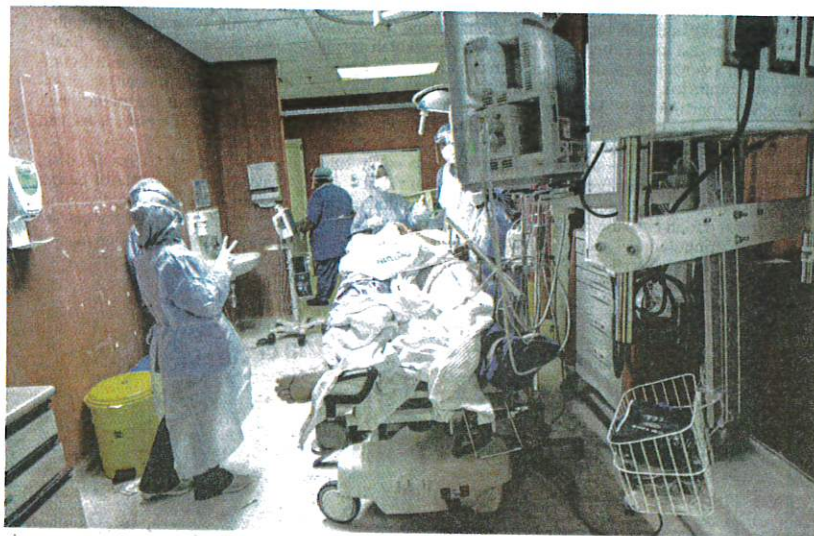
KERAJAAN melaksanakan pelbagai usaha termasuk menawarkan gaji permulaan pegawai kontrak Gred UD41 sebanyak RM5,197.