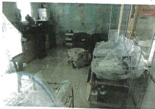
SALAH satu ruangan menjaga bayi yang terdapat dalam pusat rawatan dan penjagaan ibu bersalin di Bandar Bukit Raja, Klang.

"Selain itu, ia merupakan kediaman yang dijadikan premis perniagaan seterusnya me-