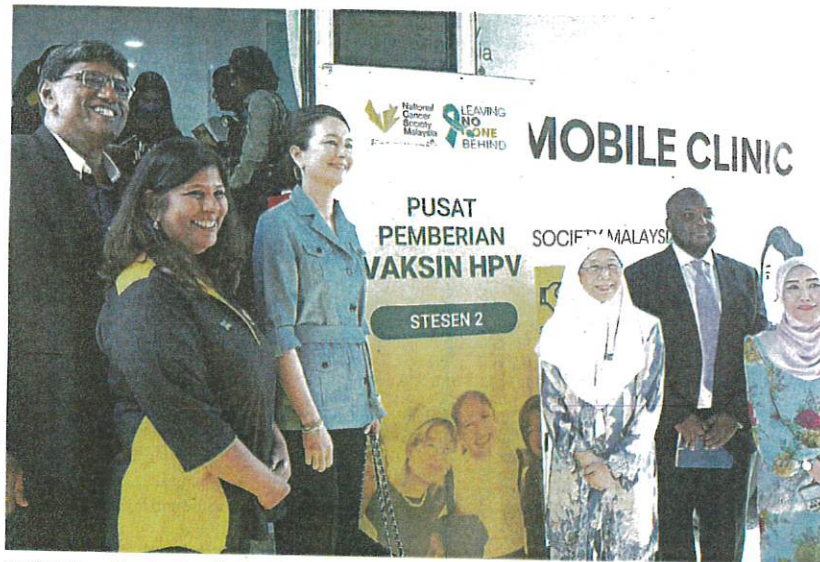
Saving lives: Tuanku Zara (third from left) posing for pictures alongside Dr Wan Azizah (third from right) and others at the launch of the vaccination programme at Dewan Serbaguna Bandar Baru Tambun.

"I never knew about cervical cancer until one of my relatives is enduring hardship due to the disease.