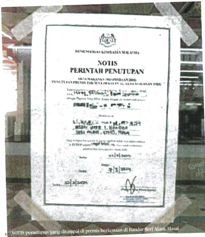
NOTIS penutupan yang ditampal di premis berkenaan di Bandar Seri Alam, Masai.

AKHBAR : HARIAN METRO MUKA SURAT : 12 RUANGAN : LOKAL