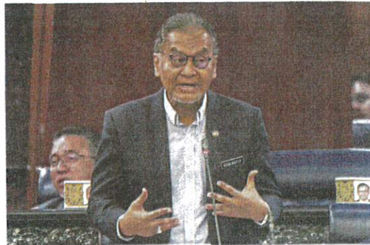
Health Minister Datuk Seri Dr Dzulkefly Ahmad says the government has implemented initiatives to ensure medical officers stay in the public sector.

He said the government provided incentives for specialised studies through fully paid study leave with federal training allowance and the skills training